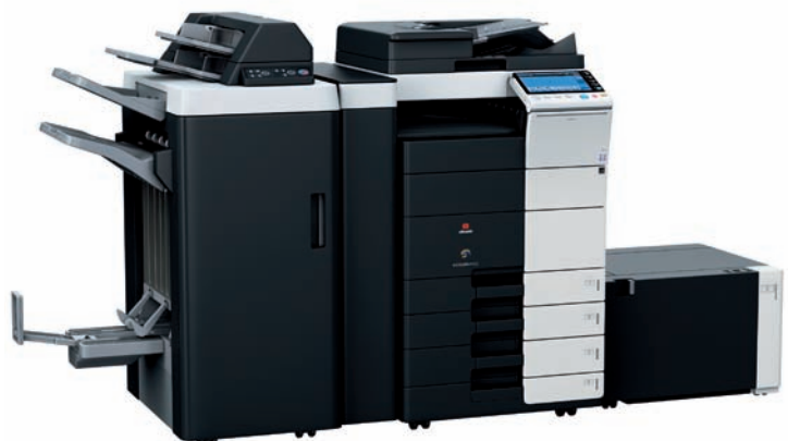
d-Color MF452 - MF552