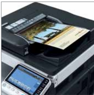
DUAL SCANNER bis zu 180 Originale pro Minute

Die erweiterten und verbesserten Druckfunktionen der neuen Olivetti -Modelle konzentrieren sich auf die vollautomatische Produktion von hochprofessionellen Dokumenten. Dank der Möglichkeit zwischen drei verschiedenen Finishern wählen zu können, hat der Anwender stets die ideale Lösung zur Verfügung, um qualitativ hochwertige Dokumente (z.B. Broschüren, Flyer, Präsentationen, Schulungsunterlagen) produzieren zu können. Die einzelnen Funktionen des jeweiligen Finishers können durch Anpassung der optionalen Module je nach Bedarf optimiert werden (z.B. Locheinheit, Broschüren- und Falzeinheit).