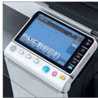
BEDIENER-KONSOLE 9.5" kapazitives Touch-Display