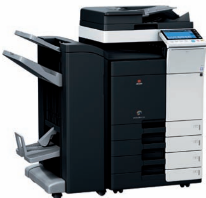
d-Color MF222- MF282 - MF362